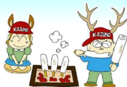
かつの商工会イメージキャラクター 「やくっち・りなっち」 画：漫画家 やくみつる氏©

【本 所】〒018-5201 鹿角市花輪字柳田14-1 Tel : 0186-22-0050 / Fax : 0186-23-2698 E - mail : kazuno@skr-akita.or.jp