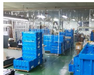
工場にビニールを設置

会社で新しく何か始める時には対象となる補助金が無いか商工会に聞いています。今回もちょうどよい補助金があったので、工事費の3/4を補助してもらいました。