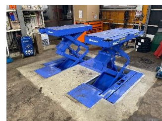
リフトの導入により作業効率が向上

新型コロナの感染拡大で外出自粛が増えたことで来店されるお客様が減る中、自動車整備業としてステップアップしたいと商工会に相談したところ、補助金活用の提案を受けチャレンジしました。お客様が気になる車内の除菌が行えるようにオゾン脱臭機を導入し、顧客サービスの充実を図りました。また、コロナ禍でさらに人材確保が難しくなる中、作業負担の軽減と業務の効率化を図るため新たにリフトを設置し、お客様と従業員の満足度を向上させることができました。