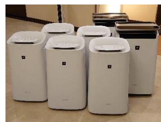
プラズマクラスター空気清浄機

ウィズコロナでは新型コロナ等の感染予防対策は必須のものとなっており、お客様の衛生面への意識も日増しに高まっております。当館では、食事の個食提供など独自の対策を行っていましたが、よりお客様が安心してお食事の時間を楽しんでいただけるように、お客様が集まる大小5つの宴会場に新たに プラズマクラスター空気清浄機 を設置し、当館の予防対策を周知するために WEBサイトをリニューアル いたしました。補助金活用により導入負担の軽減につながりました。