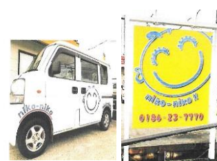
営業車両のロゴと改修後の看板

コロナ禍で団体の会合が減る中、個人客の増加を図ることを目的として、当店では商工会独自の伴走型支援補助金を活用し、車道側に設置している 看板の改修 および 営業車両へのロゴマーキング を行いました。取り組みの後、「看板を見て、初めて（お店の存在に）気付いた！」「早い時間に配達されていますね、車を見かけました。」などの声を頂いており、会社の認知度向上、新規顧客および売上の増加につながりました。