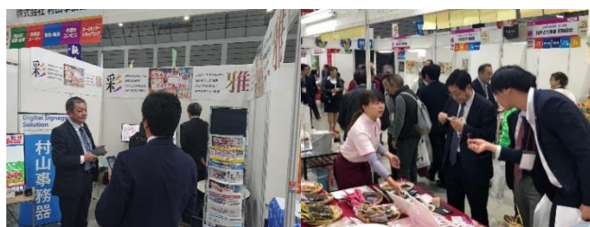
ビジネスマッチ東北2019での商談の様子

※新型コロナ感染防止対策等の社会要請上やむを得ない理由により、リアル展示会の開催が困難と判断された場合、WEB展示のみに変更される場合があります。